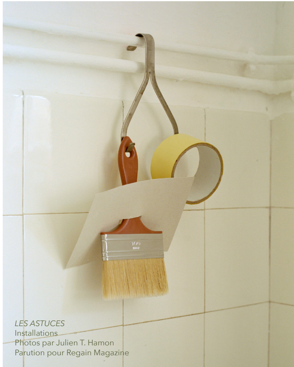
LES ASTUCES Installations Parution pour Regain Magazine