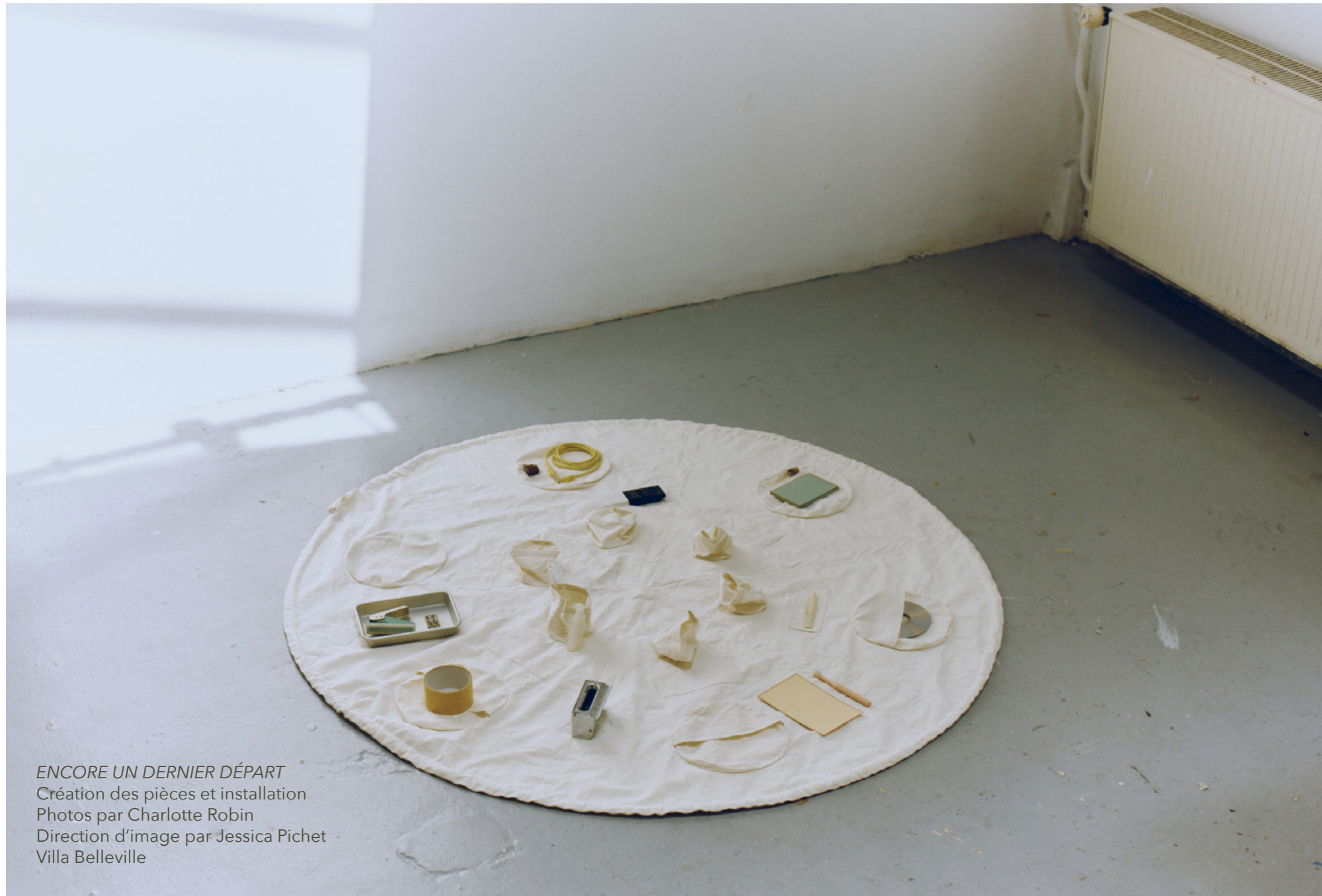
ENCORE UN DERNIER DÉPART Création des pièces et installation Direction d'image par Jessica Pichet Villa Belleville