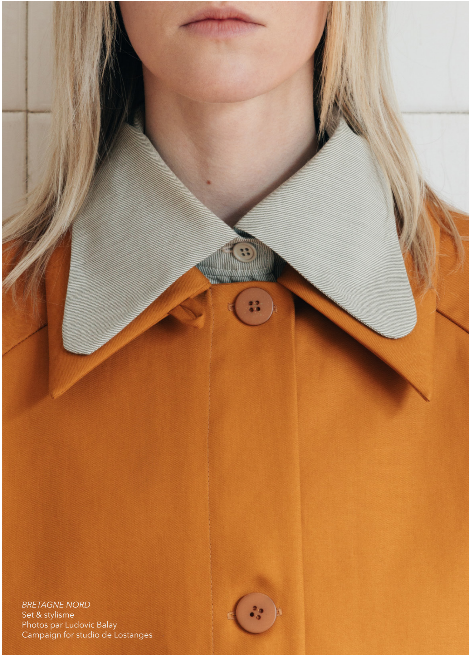
BRETAGNE NORD Set & stylisme Campaign for studio de Lostanges