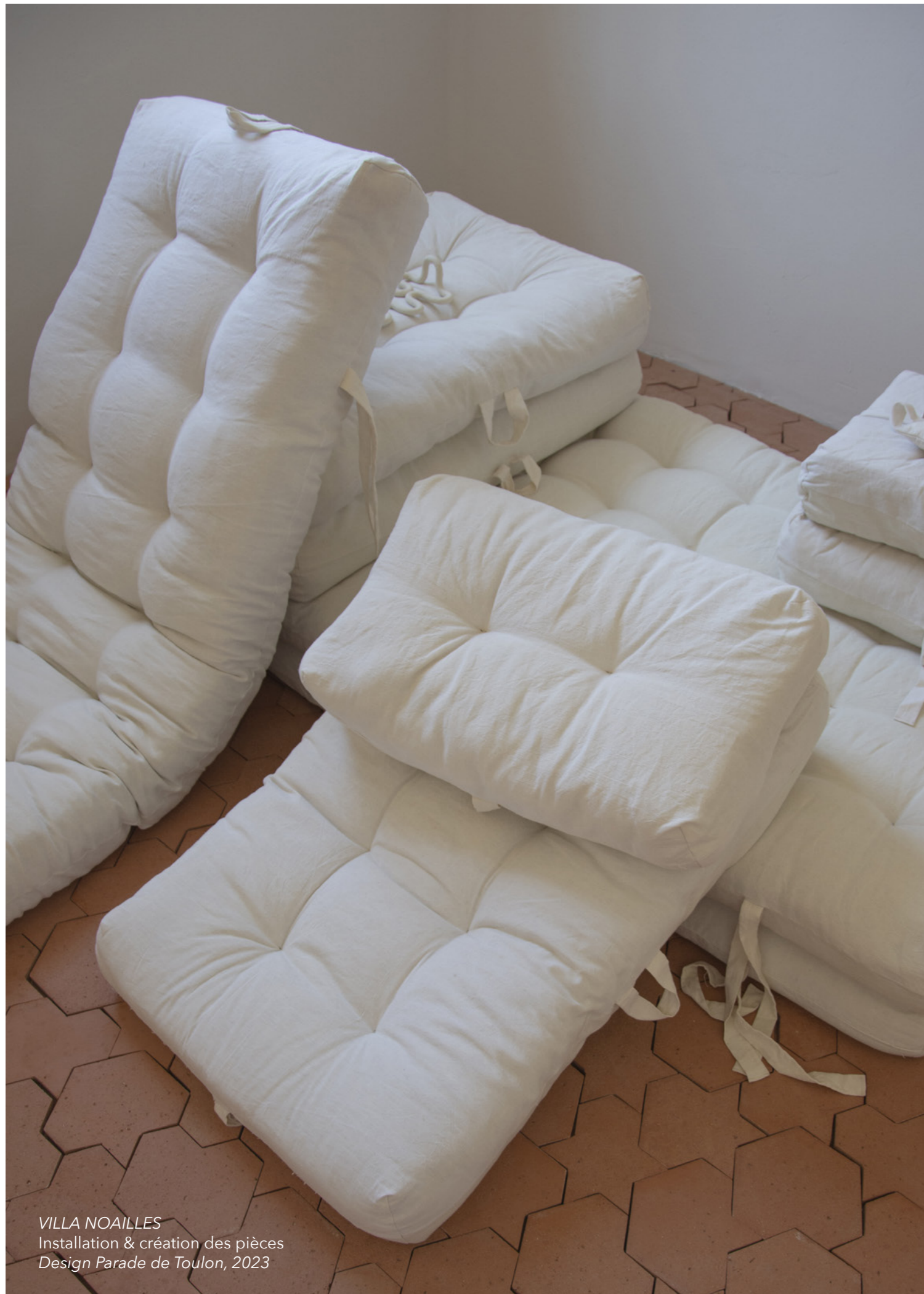
VILLA NOAILLES Installation & création des pièces Design Parade de Toulon, 2023