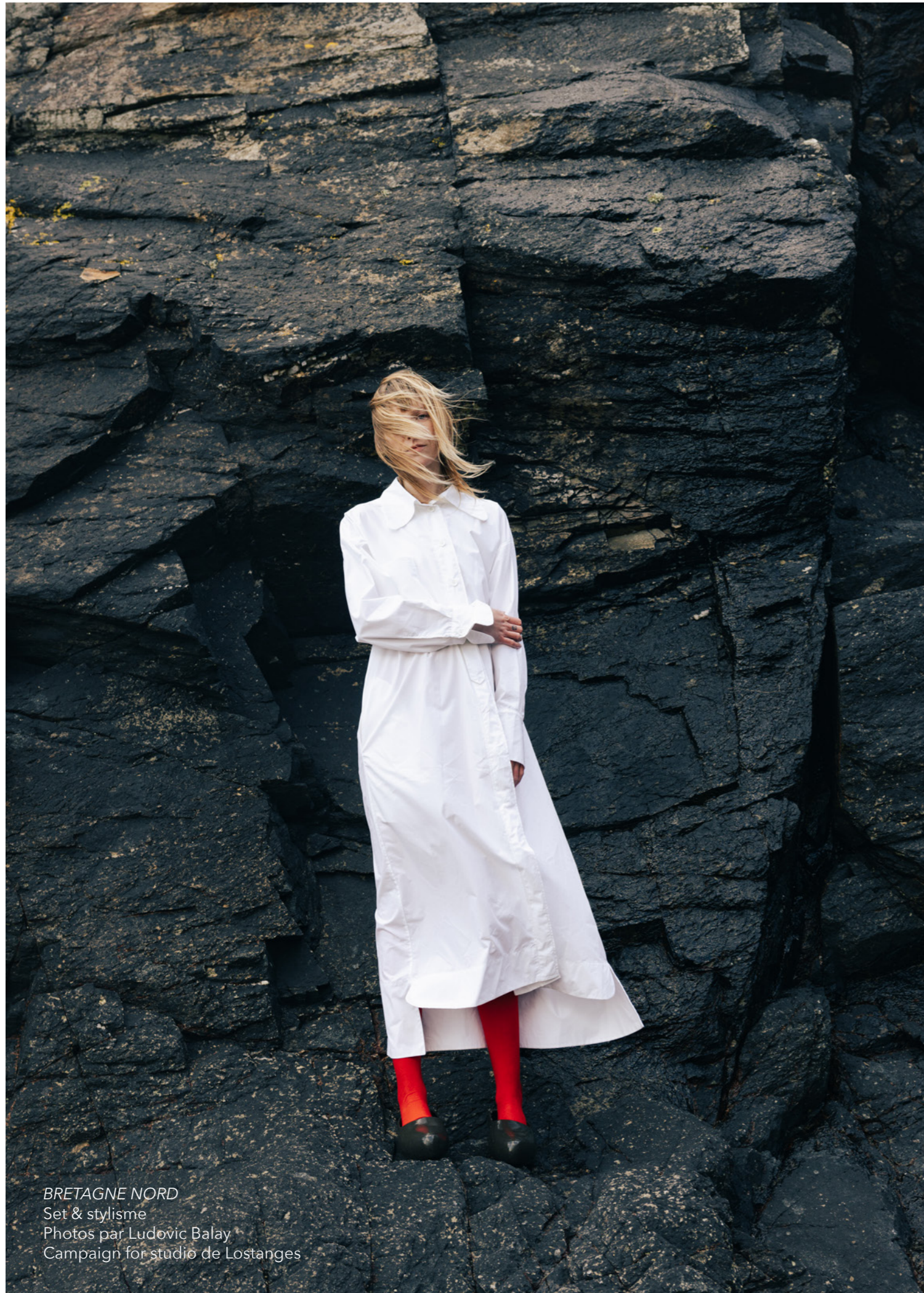
BRETAGNE NORD Set & stylisme Campaign for studio de Lostanges