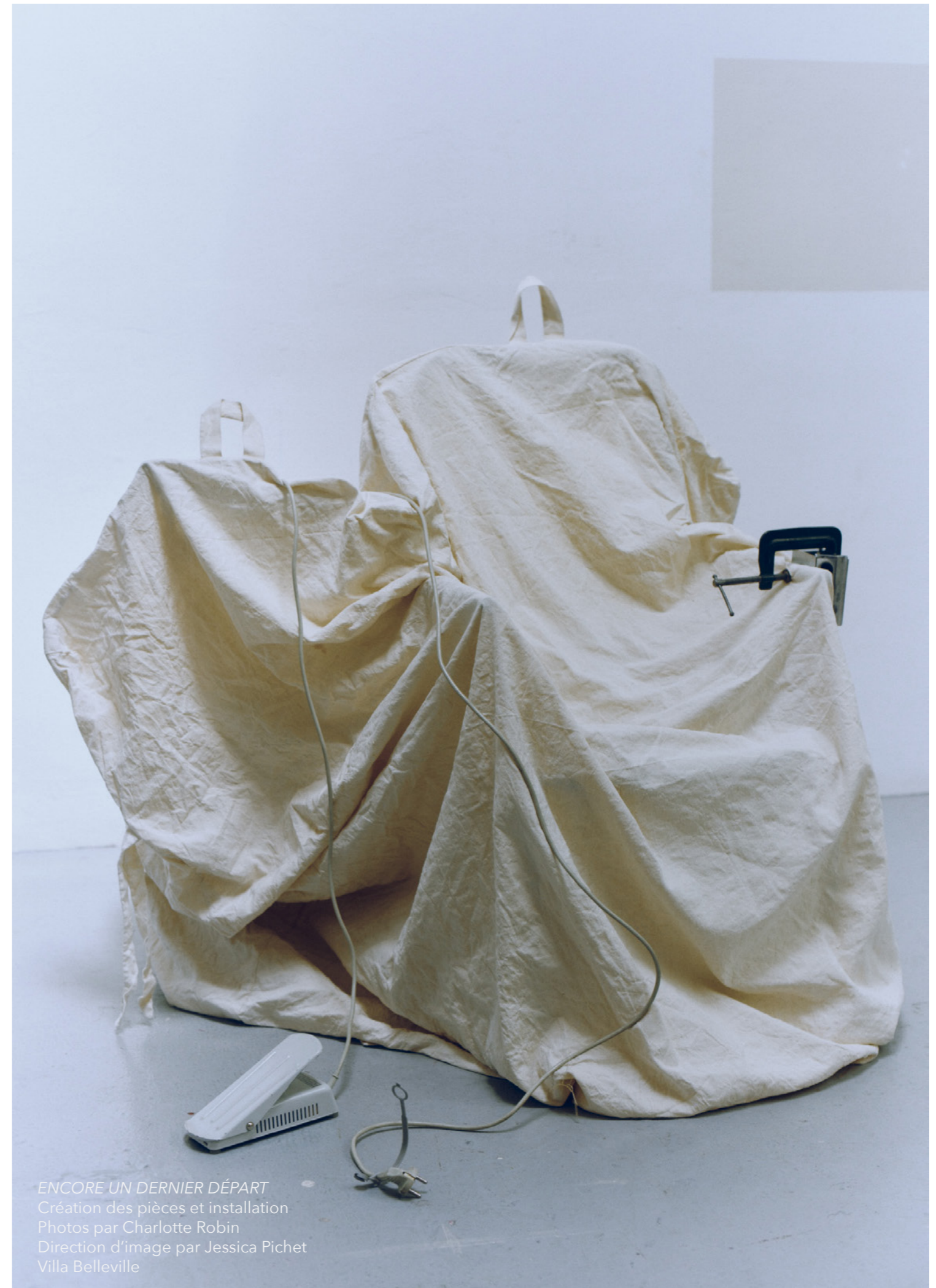
ENCORE UN DERNIER DÉPART Création des pièces et installation Direction d'image par Jessica Pichet Villa Belleville