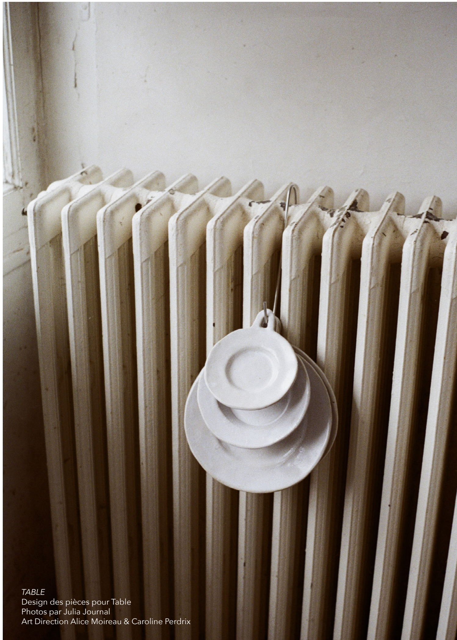
TABLE Design des pièces pour Table Art Direction Alice Moireau & Caroline Perdrix