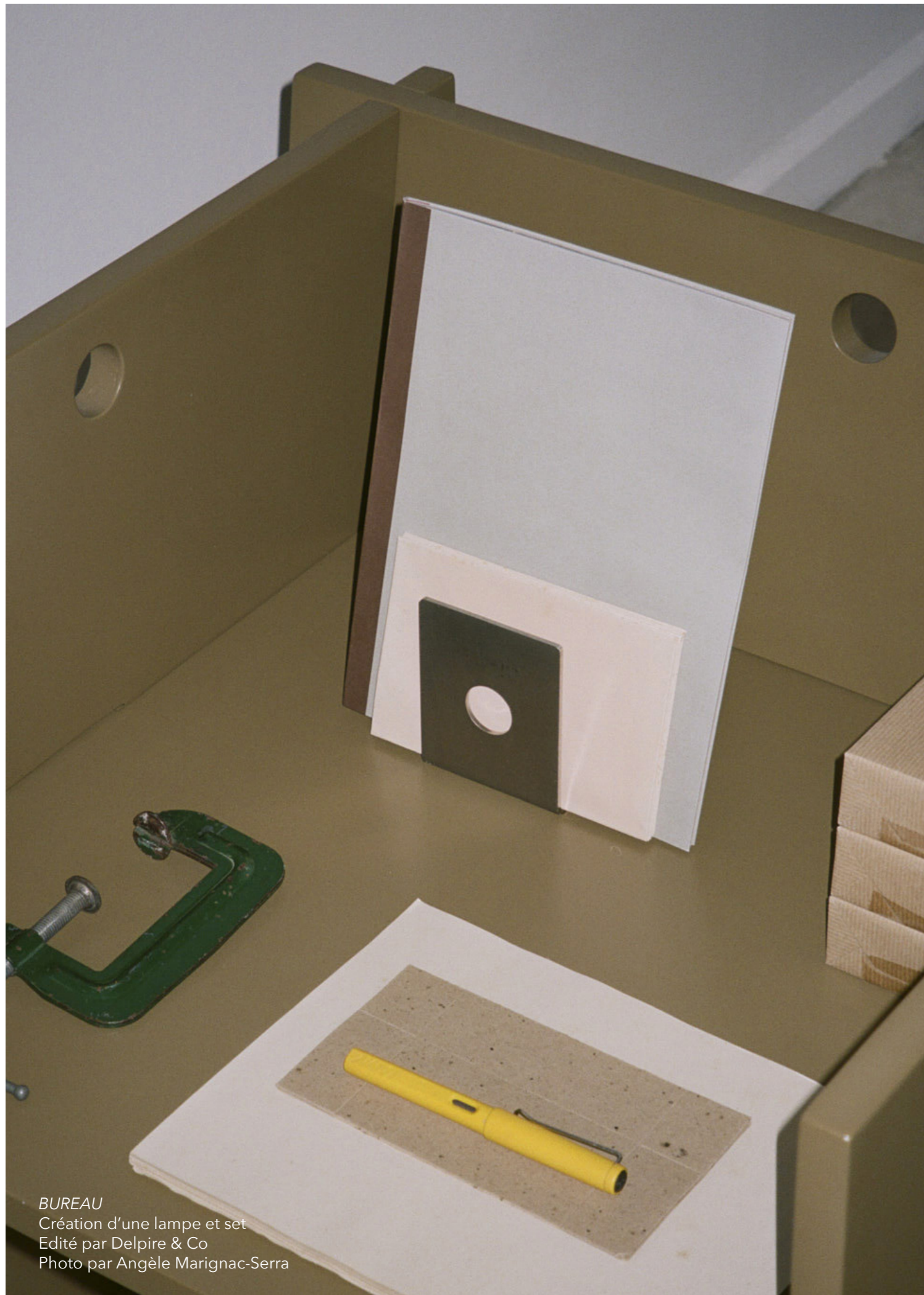
BUREAU Création d'une lampe et set Edité par Delpire & Co