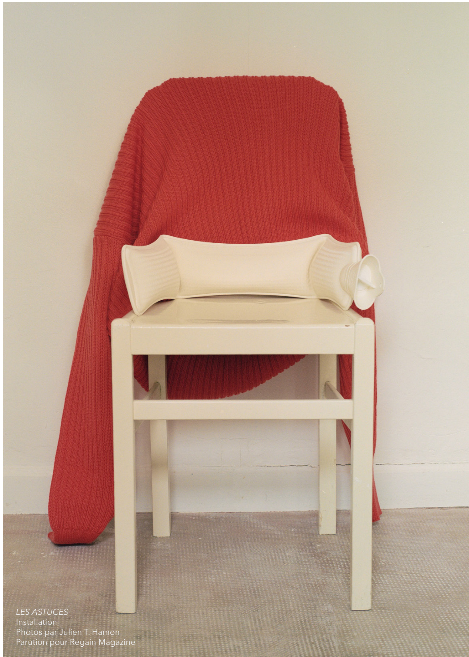
LES ASTUCES Installation Parution pour Regain Magazine