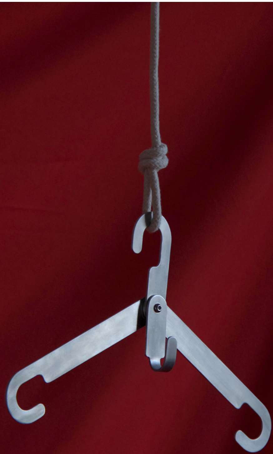
PROMENADE Création du cintre & Installation Les ateliers du Magnolia x Arcade