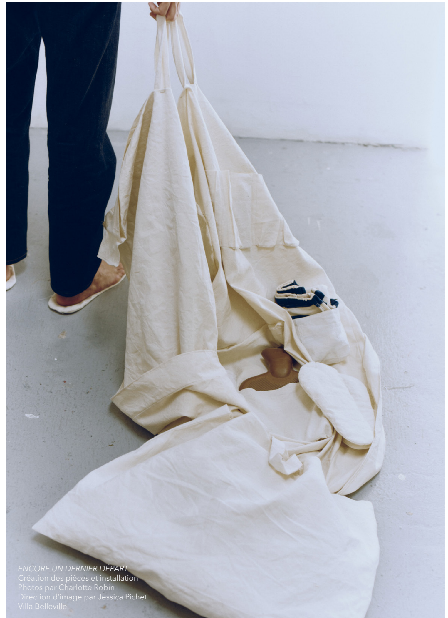
ENCORE UN DERNIER DÉPART Création des pièces et installation Photos par Charlotte Robin Direction d'image par Jessica Pichet Villa Belleville