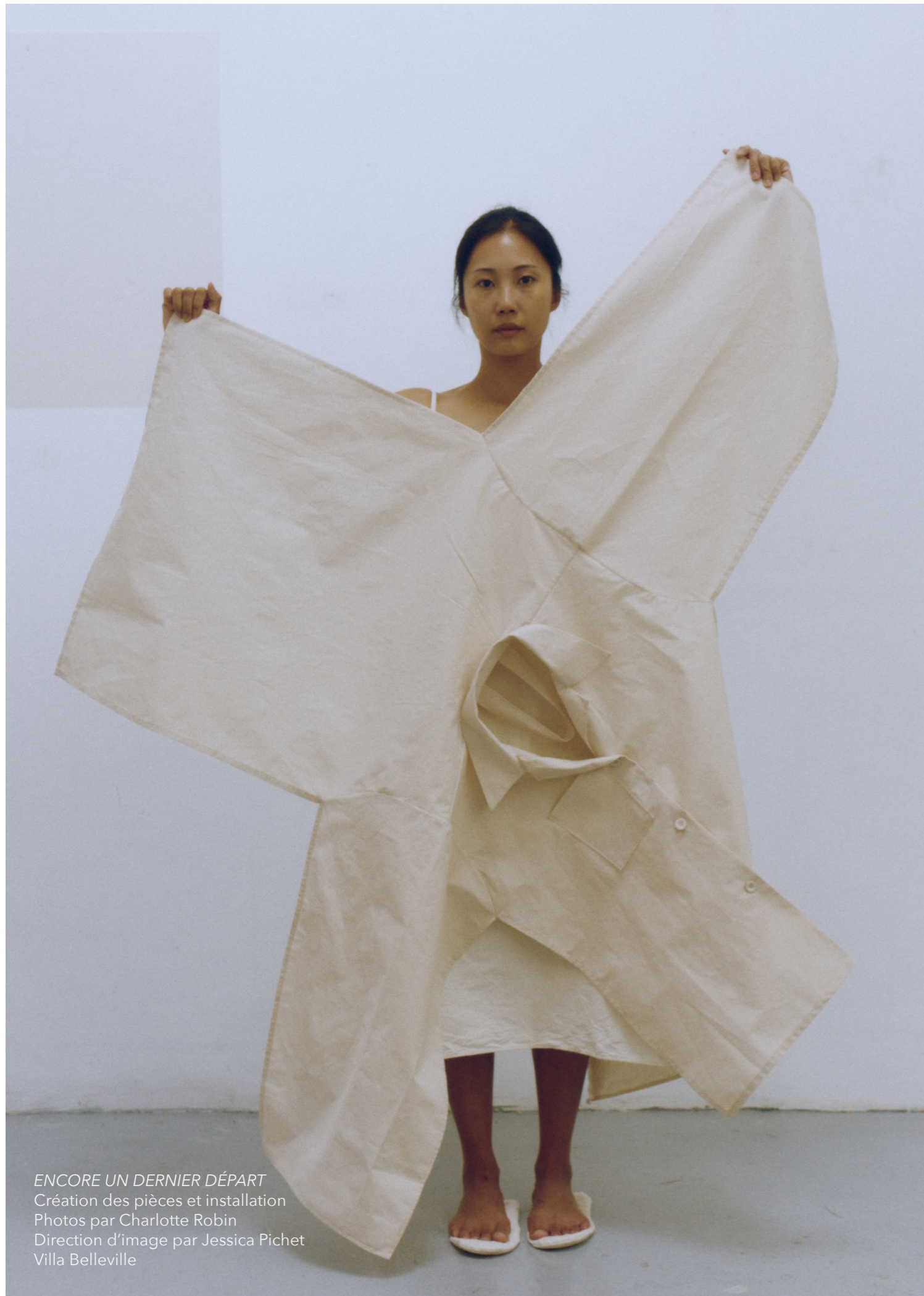
ENCORE UN DERNIER DÉPART Création des pièces et installation Direction d'image par Jessica Pichet Villa Belleville