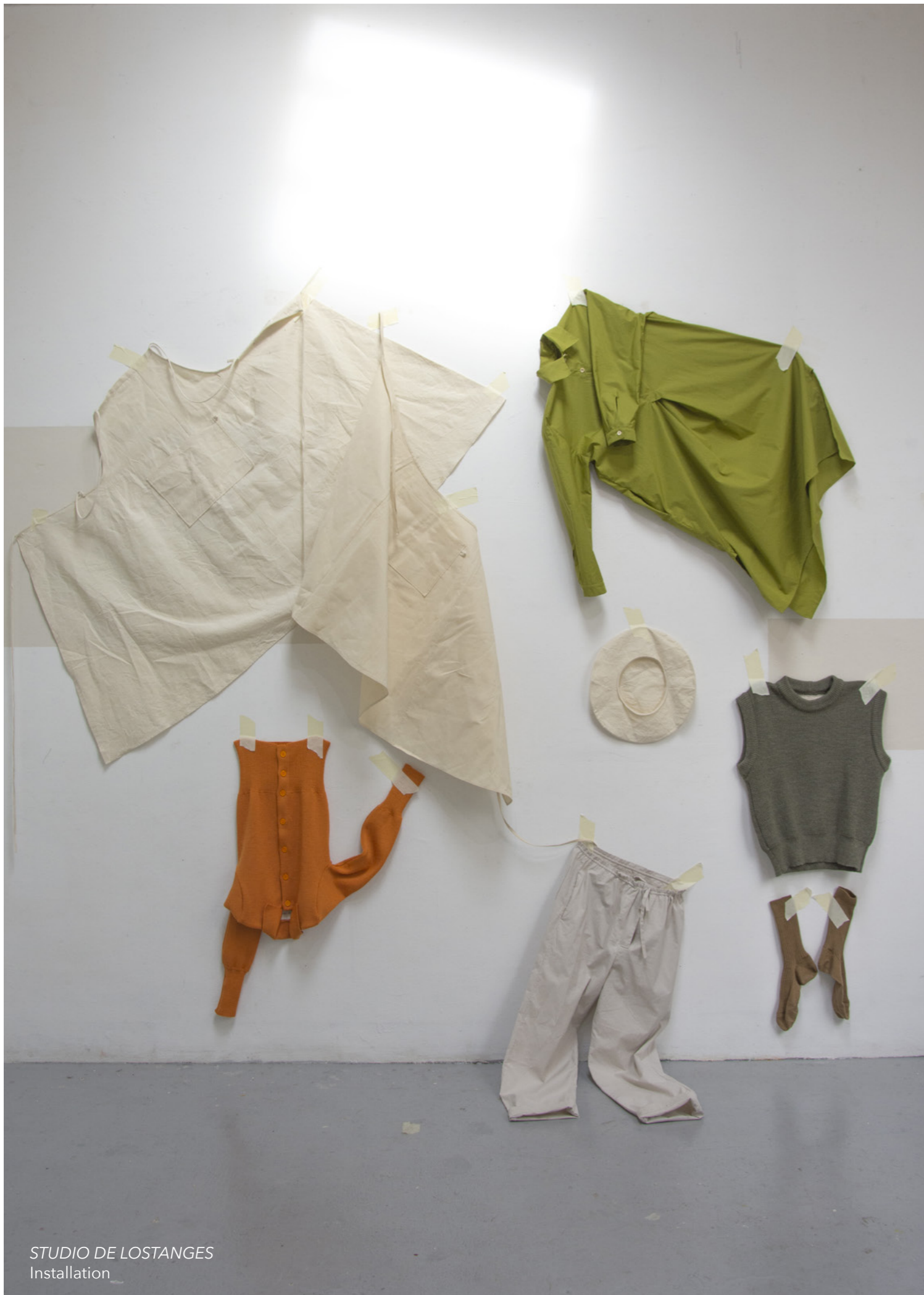
STUDIO DE LOSTANGES Installation